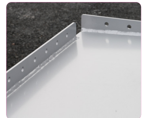
Obere Einfassung mit Befestigungspunkten für den Betankungsschlauch sowie Zapfpistole