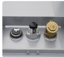
Analoger Füllstandsanzeiger, 2" Tankverschluss, 1" Überdruck-/Vakuumventil.