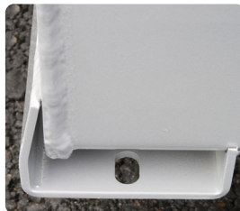
Schutzkufen mit Einbauhalterungen für die Ladefläche