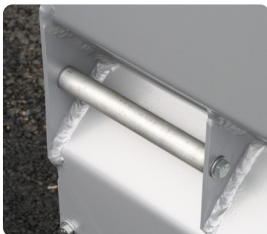
Hub- und Lastbefestigungen auf allen vier Seiten.