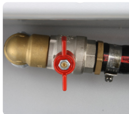
Montiertes Kugelventil und Schlauchnippel 3/4 Zufuhranschluss